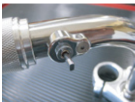
アルミ削り出し メッキ仕上げ

穴あけ加工をする際には、穴あけ加工ブロック(φ1"用 品番880205、φ7/8"用 品番642205)を使用することでスムーズに作業が行えます。