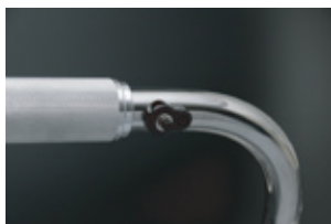
アルミ削り出し ブラックアルマイト仕上げ