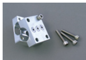
穴開け加工ブロック 各¥7,875