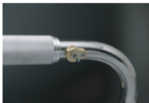
真鍮削り出し仕上げ