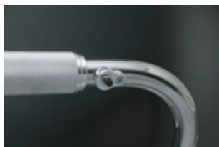
アルミ削り出し仕上げ